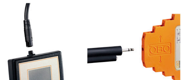
工作状态下进行产品测试